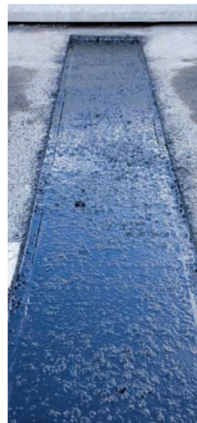
Na afgieten is de voeg gevuld en gereed voor het afstrooien