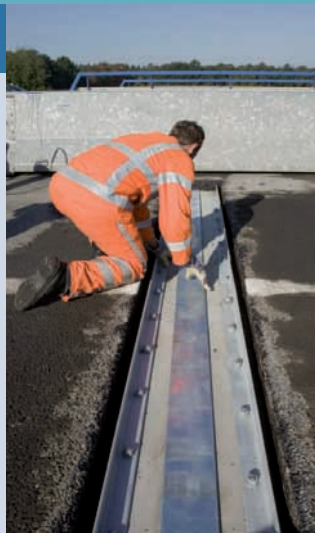
Aanbrengen stalen onderplaat die wordt afgedekt met een scheidingsmat en afgegoten met rubberbitumen