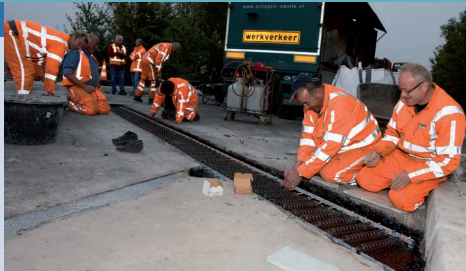
Aanbrengen en spannen van de spiraalveren tussen de hoekprofielen