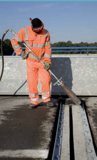
De ondergrond wordt met lucht gereinigd nadat de betonnen voegranden zijn gerepareerd en de stalen hoekprofielen maatvast zijn gemonteerd