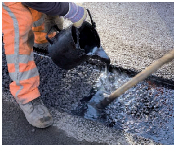
De voegvulling van (vooromhulde) Electro Oven Slakken en rubberbitumen wordt laagsgewijs aangebracht