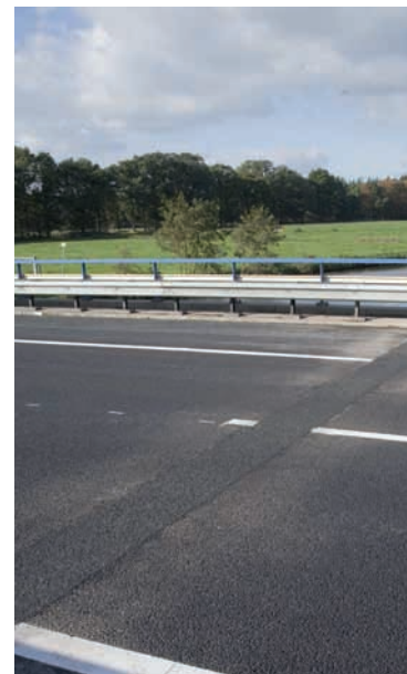
Gereed voor gebruik

rubberbitumen wordt laagsgewijs aangebracht.