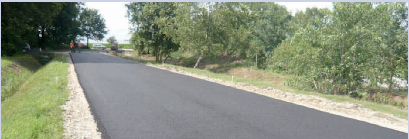
BSA 100 is gewoon asfaltbeton. Maar met hergebruikt bitumen

opnemen van dit materiaal in de wegebouw. Met het ministerie van VROM is daar jarenlang over van gedachten gewisseld. Met de uitvoering van het demonstratieproject in Venray is een doorbraak bereikt over de technische en milieuhygiënische mogelijkheden.