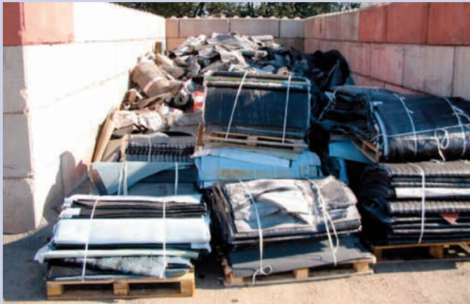
Opslag oud dakbedekkingsmateriaal