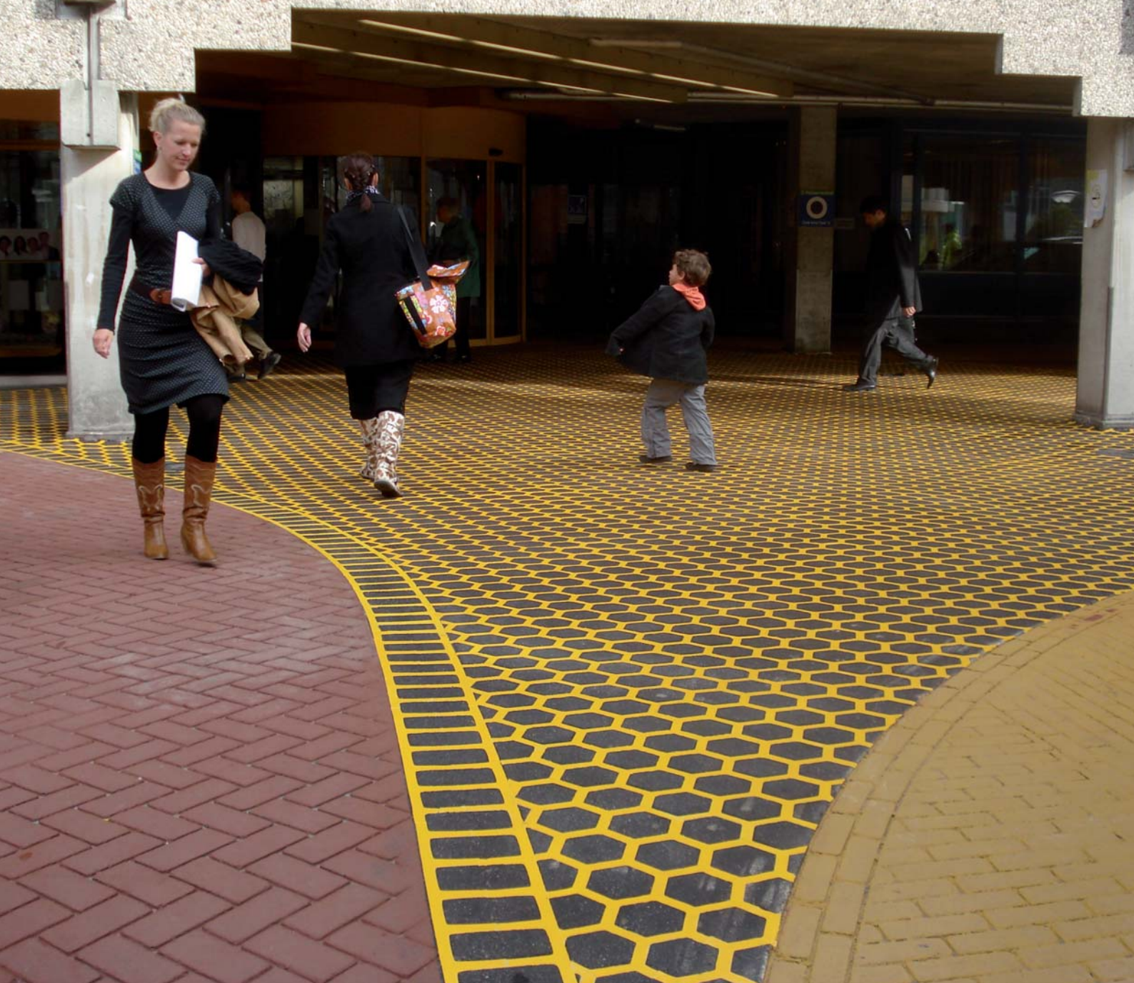
Verschillende technieken zorgen voor een bijzonder visueel effect

ler versmolten met het asfalt. Zo blijft het zeer comfortabel voor rolstoelgebruikers, rollatorgebruikers en patiënten die slecht ter been zijn. Het vlakke oppervlak zorgt ervoor dat het geen struikelblok meer vormt voor patiënten van de polikliniek. De toepassing van DuraTherm is ideaal als aanvullende markering van kruisende functies waarbij extra voorzichtigheid geboden is zoals bij oversteekplaatsen en schoolzones.