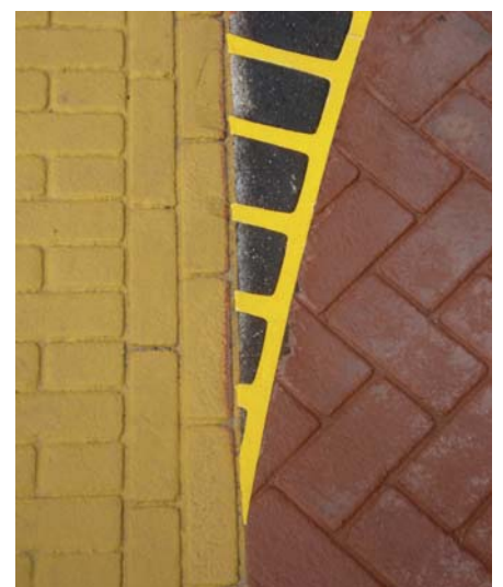
Detail aansluiting verschillende kleuren, technieken en verbanden

Bijgevoegde foto's geven een beeld van het bijzondere visuele effect van het vlakke oppervlak.