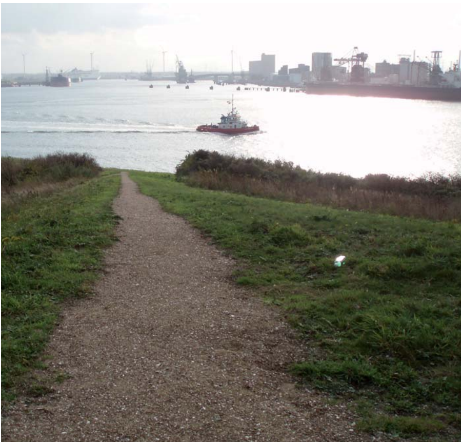
Uitzicht van de parkeerplaats op de haven

De kop van de landtong Rozenburg biedt een weids uitzicht over de komende en gaande schepen van de haven van Rotterdam. De gemeente heeft dit uitzicht nog verbeterd door de kop te verhogen en op het hoogste deel is een parkeerplaats aangelegd. Gelijktijdig is het landschap zo ingericht dat er een rijke fauna ontstaat.