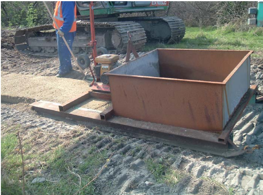
Speciale bak met trilplaat (afwerkmachine) voor de aanleg