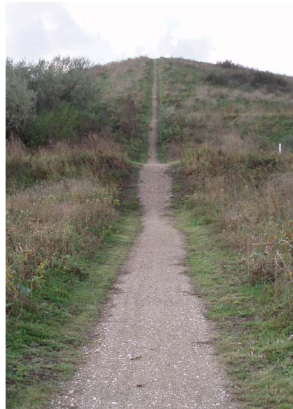
Het pad enige tijd na aanleg