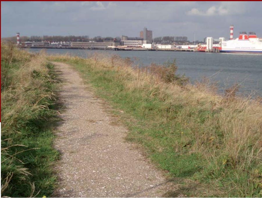
Pad langs de waterlijn rond de landtong