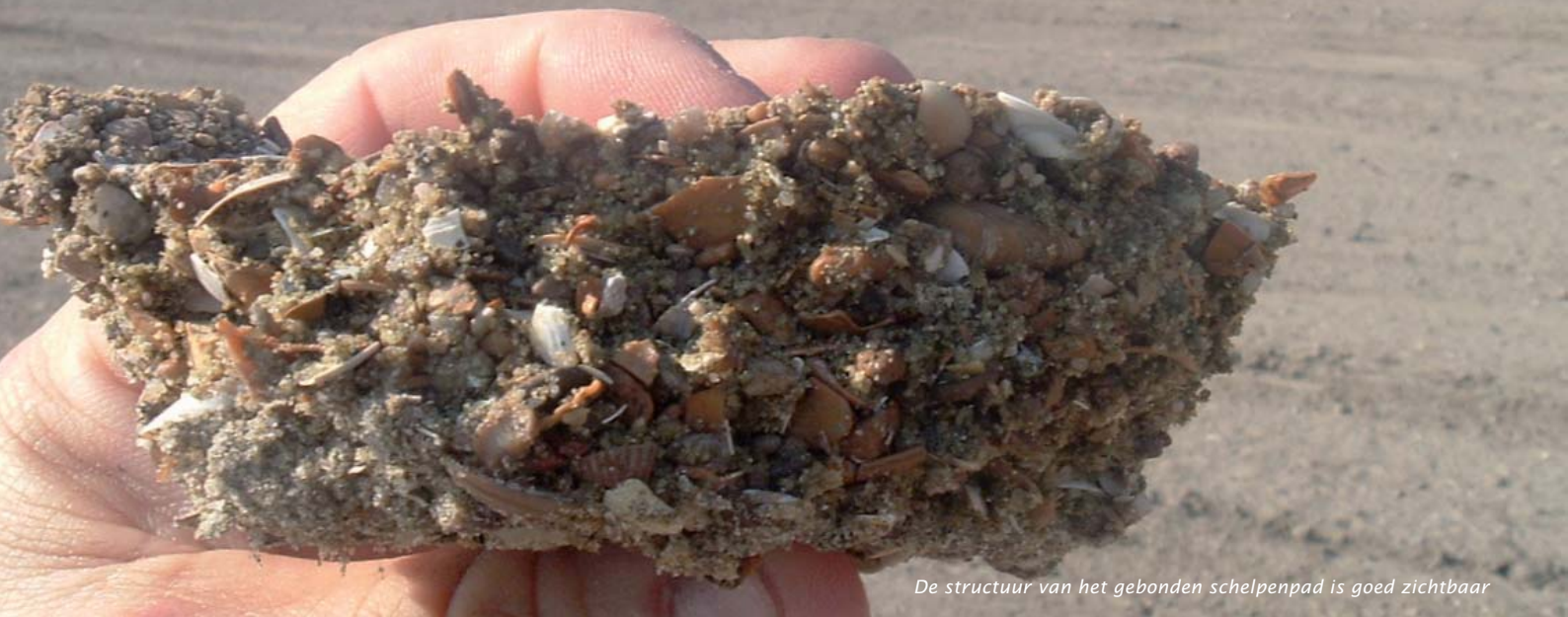
De structuur van het gebonden schelpenpad is goed zichtbaar