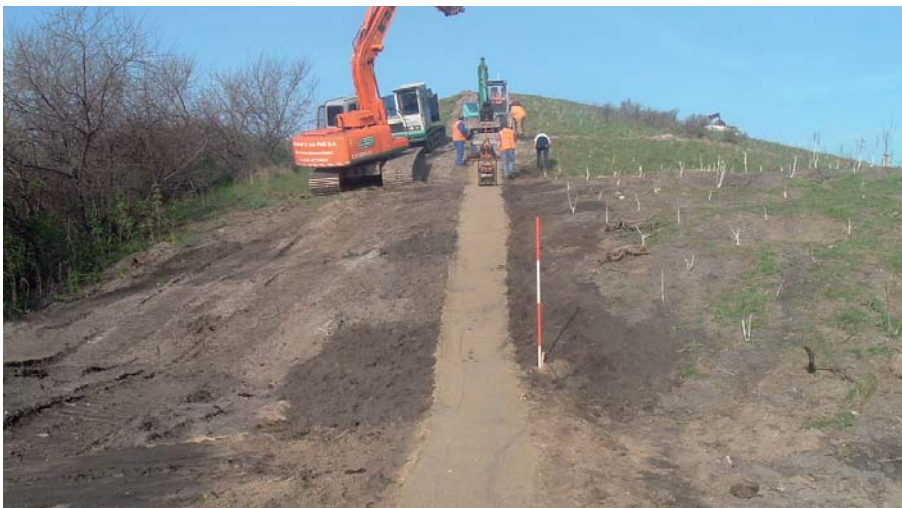
Pad van parkeerplaats naar de waterlijn volgt de ondergrond