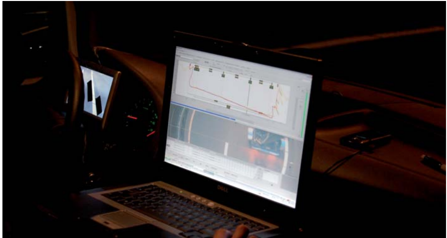
Beeld operator tijdens meting

De auto rijdt tot het referentiepunt in het beeldscherm verschijnt. De aanhanger wordt automatisch met hydraulische stempels gestabiliseerd. De operator geeft eventuele bijzonderheden op het scherm aan. De knop voor de meting wordt ingedrukt en het resultaat beoordeeld. Incidenteel voldoet dit niet en wordt de meting over gedaan. De hydraulische stempels van de aanhanger schuiven in en de auto rijdt naar het volgende punt. In ongeveer 40 seconden is deze hele cyclus doorlopen. Rekening houdend met wat tijd voor de start en onverwachte omstandigheden is het vastleggen van 60 dwarsprofielen per uur een reëel uitgangspunt.