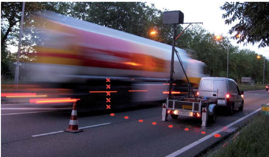
Invloed verkeer direct zichtbaar in meting

Vanzelfsprekend moet de meetopstelling langs het project kunnen rijden. Hoe donkerder het oppervlak hoe minder licht er gereflecteerd wordt, toch kan er s'nachts bijzonder goed gemeten worden. Op het open ZOAB wordt iets in het oppervlak gemeten. Bij een traditionele waterpassing wordt de baak op de toppen van het ZOAB geplaatst. Er moet dus ten opzichte van de traditionele meting een fractie worden gecorrigeerd. Het oppervlak van de laserstraal is echter groter dan de bekende aanwijzers bij presentaties zodat de correctie in de praktijk verwaarloosbaar is. Water op een dicht wegdek zorgt voor wat verstrooiing waardoor de intensiteit van de reflectie van het wegoppervlak wat afneemt. Ook dit blijkt in de praktijk erg mee te vallen. De bij de meting ingegeven opmerkingen gecombineerd met de gelijktijdig gemaakte foto's blijken voldoende om uitbijters te