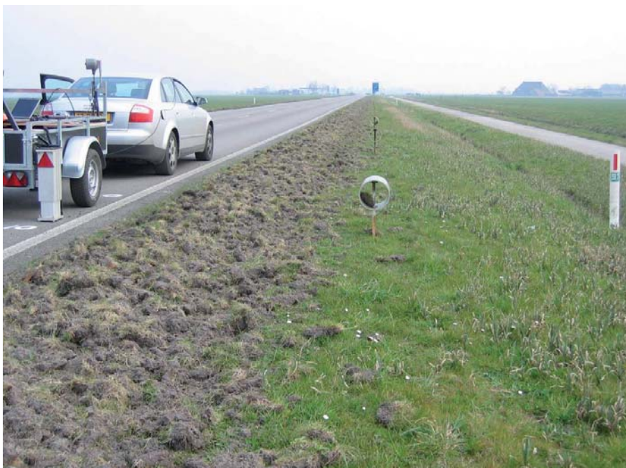
Metingen op een provinciale weg in Friesland

(pvc buis). De piketten zijn exact ingemeten en bleven tijdens het werk staan. Met pavescan zijn de dwarsprofielen van de bestaande situatie gemeten. De resultaten zijn ingevoerd in het programma PaveCalc waarin ook het gewenste profiel na frezen van de bovenste lagen is ingevoerd. Direct werd het freesplan duidelijk. Per profiel was de freesdiepte bekend. Ook na het frezen is gemeten waarna het profiel na frezen kon worden vergeleken met het gewenste profiel na aanbrenge van de asfaltverharding. De laagdikte, en daarmee ook de hoeveelheid tonnen per profiel, rolde uit de berekening. Na afloop van het werk volgde de derde meting waarmee de werkelijke hoogte is vastgesteld. Vergelijking met de gegevens uit de tweede meting leverde direct de laagdikte per profiel op. En daarmee de verwerkte hoeveelheid tonnen asfalt.