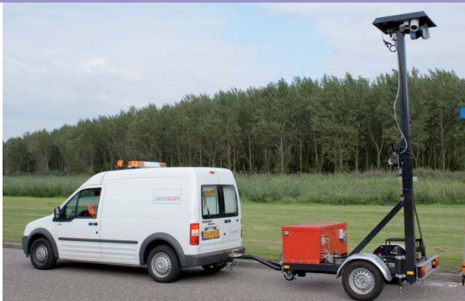
Meetopstelling tijdens uitvoering

Bij de reconstructie van de een provinciale weg in Friesland zijn drie maal de dwarsprofielen gemeten. Daarvoor zijn