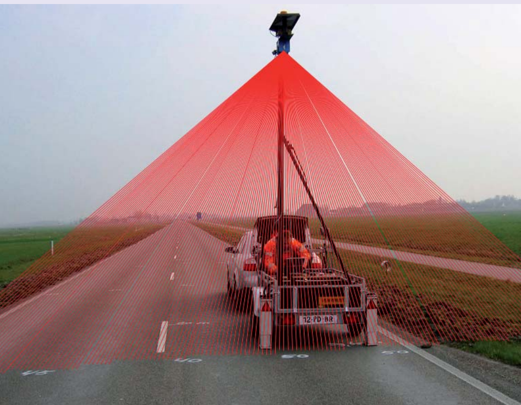
Scherf van 200 laserstralen per meting

Dwars- en lengteprofielen vormen de basis voor het ontwerp van reconstructies. Traditioneel worden de profielen via waterpassing ingemeten. Afzetten van de weg is daarvoor noodzakelijk. Scantechnologie maakt het mogelijk de metingen in het verkeer te verrichten.