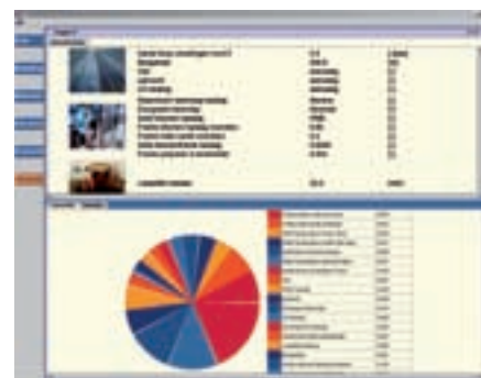
Screendump LOT met overzicht van de invloed van elke parameter op het proces.