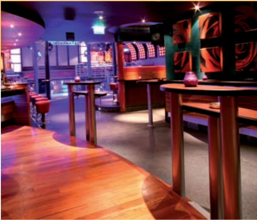
Duidelijk onderscheidt tussen de verschillende functies van de vloeren.