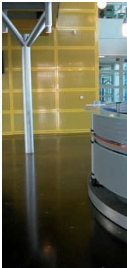
Receptie van Corus in IJmuiden

Ook de vloer moest passen in de uitstraling: strak en vlak. Het basisproduct staal komt via de ingebouwde roestvrijstalen blokjes in de vloer terug. Als afwerking is op de vloer een dunne transparante coating aangebracht. Alle bezoekers komen direct bij de entree in contact met de producten van Corus.