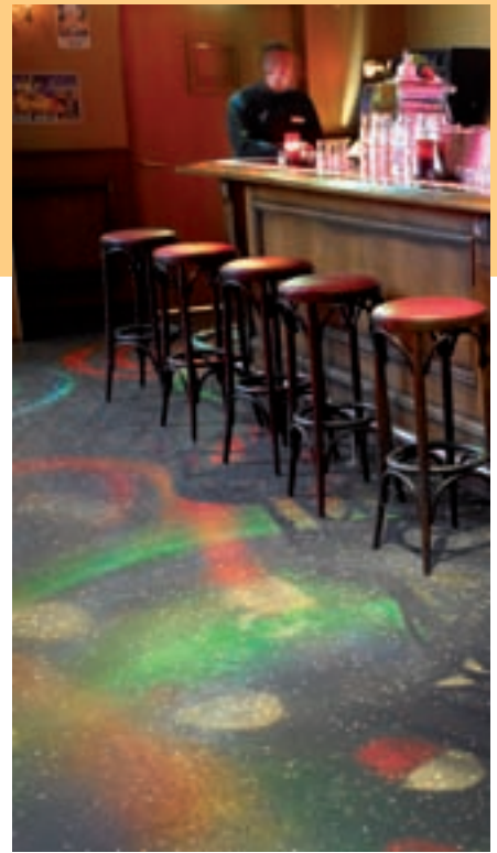
Bruine kroeg in Amsterdam

en hygiëne. Ook moet de vloer bestand zijn tegen de zware belastingen van ondermeer naaldhakken. Daarbij dacht hij aan de mogelijkheid van asfalt, maar dan wel met een luxe uitstraling passend in de entourage. Met de gepolijste asfaltvloer is dit volledig geslaagd. De strakke vloer is na het vertrek van de laatste gasten in een mum van tijd schoon; een paar emmers water er over en droogtrekken.