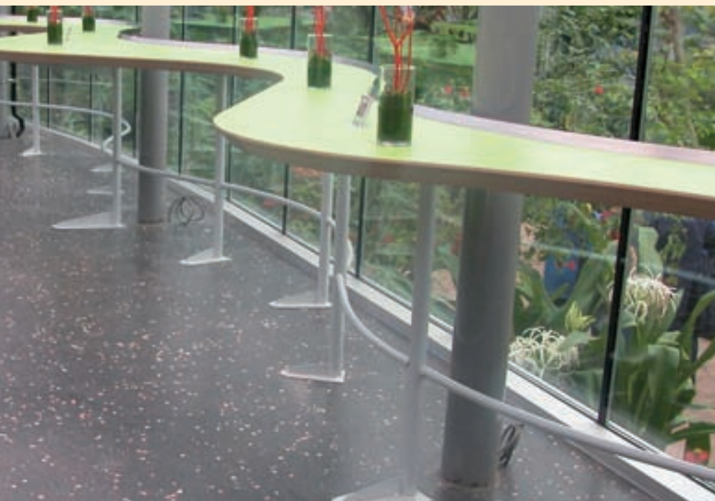
Vlindertuin Artis: Karretjes van de horeca rijden bijna geruisloos over het asfalt.

Het mengselontwerp moet zorgvuldig plaatsvinden. Het mineraal aggregaat moet zich niet alleen lenen voor polijsten, het moet ook de gewenste kleur en uitstraling na bewerking hebben. De te gebruiken bitumen moet extreem hard zijn. Zeker bij toepassingen binnen is een potdicht oppervlak noodzakelijk. Daarom zal in veel gevallen gekozen