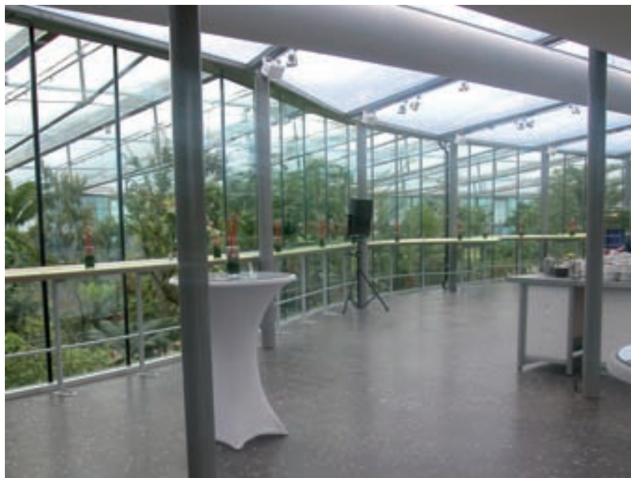
Gereed voor ontvangst gasten.

Dierentuin Artis wilde een vlindertuin om circa duizend vlinders van twintig verschillende soorten te huisvesten. De architect kreeg de opdracht een paviljoen te ontwerpen met een tuin waar de bezoekers tussen de vlinders door kunnen wandelen en de metamorfose van pop naar vlinder in poppenkasten kunnen volgen. Voor de wetenschappers moest