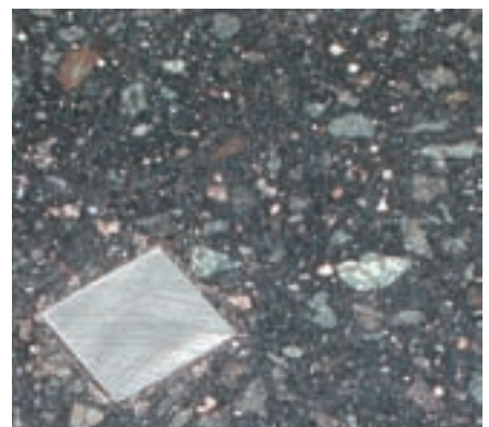
Detail met blokje staal