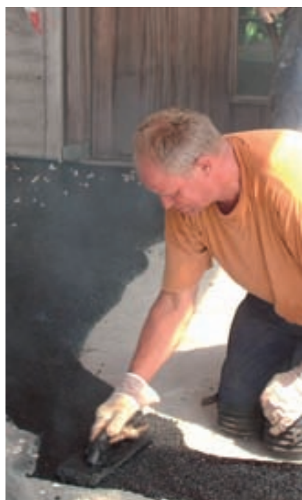
Met de spaan aanbrengen asfalt vereist vakmanschap.

er een laboratorium komen en voor de bezoekers moest er een horecagedeelte met zicht op de vlinders komen.