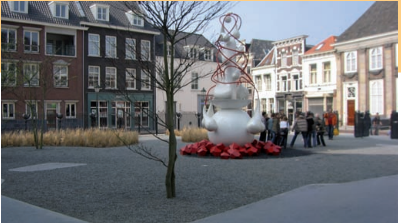
Op hele uren water en stoom spugende fontein. Geïntegreerd samenspel met duidelijke functiescheiding.