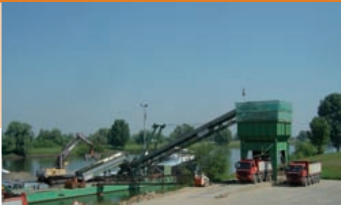
Loswal aan de Maas