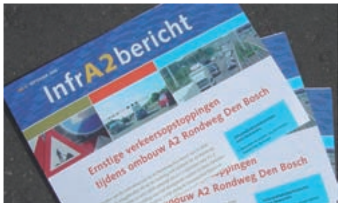
Nieuwsbrief 'InfrA2 bericht' wordt huis-aan-huis verspreid

schermen, met een hoogte van 2 tot 9 meter, worden opgebouwd uit betonnen panelen van 8 meter lengte.