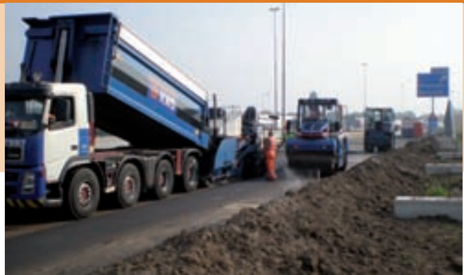
Uitvoering op vierkant afgesloten wegvak