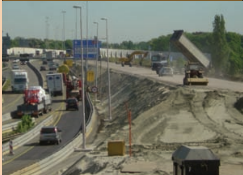
Doorstroming verkeer tijdens de bouw

Wouter den Hartog; Communicatiemanager InfrA2