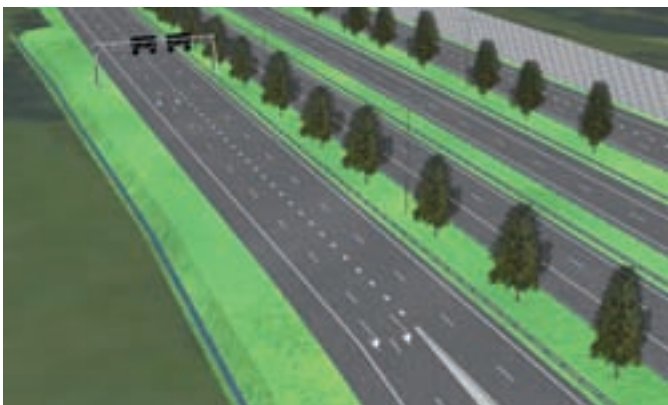
Artist impressie wegingdeling