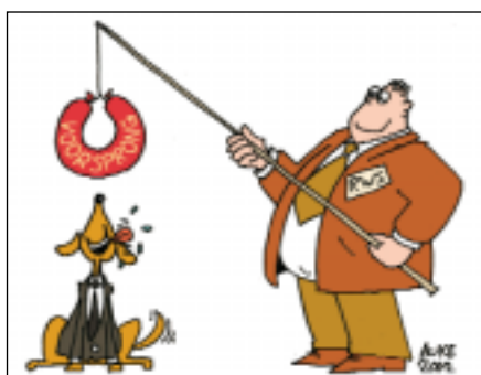
De voorgehouden worst moet bereikbaar zijn

nemer een voorsprong op de markt moet worden gegeven als hij een succesvolle innovatie heeft. Als aan deze voorwaarde niet wordt voldaan, is er geen enkele stimulans.