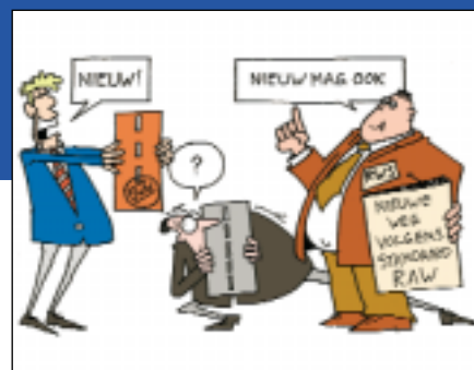
Technisch certificaat verhoogt kans op acceptatie toepassing

Hoe kan een ondernemer nu zijn geld terug verdienen als alles openbaar moet worden aanbesteed en je geen merknaam mag voorschrijven? Er zijn binnen RWS mogelijkheden, zeker in een uitgebreide proeffase, om het werk op te dragen aan een specifieke aannemer. De ontwikkeling van meer innovatieve con-