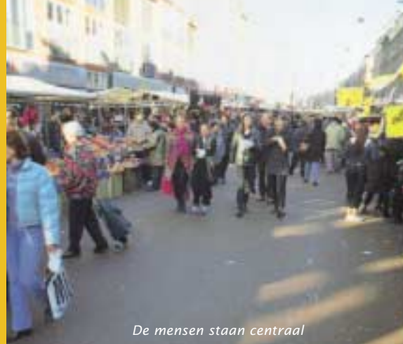
De mensen staan centraal

De asfalttechnologie staat aan de vooravond voor een aantal ingrijpende veranderingen. De normen waaraan de kwaliteit wordt getoetst gaan veranderen en de technische en technologische ontwikkelingen bevinden zich in een stroomversnelling. Op 27 september 2001 organiseerden Benelux Bitume, CROW, DWW-RWS, TU-Delft en VBW-Asfalt de bijeenkomst 'Asfalttechnologie na 2003' waarin beeld is geschetst van de veranderingen en hun effect op de asfalttechnologie. De teksten zijn een bewerking van de voordrachten.