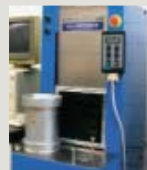
Gyrator wordt bij invoering Europese normen voorgeschreven