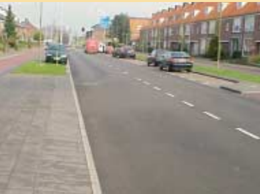
Wegoppervlak is finishing touch

maar anders. Een dunne laag heeft geen extreme verdichtingsenergie nodig, maar de regel "De eerste klap is een daalder waard" geldt met nadruk.