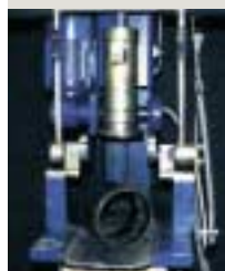
Marshallhamer gaat verdwijnen