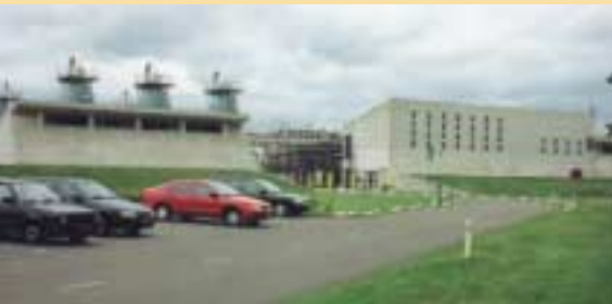
Koude sma in Langelo (1997)

en/of schuimen. Door toevoeging van flux is een lagere productietemperatuur mogelijk en met emulgeren of schuimen kan verwarming van het aggregaat zelfs achterwege blijven. Combinaties van deze technieken staan in de belangstelling.