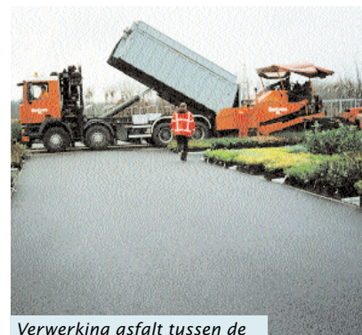
Verwerking asfalt tussen de al in gebruik genomen velden