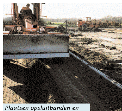
Plaatsen opsluitbanden en aanbrengen menggranulaat