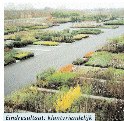
Eindresultaat: klantvriendelijk en bedrijfseconomisch